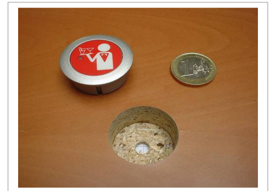
Ruf-Knopf Mini: 30mmØ x 13mm

So kann dieser kleine Funkruf-Knopf „Mini“ leicht und schnell z.B. in Biergarten-Tische, in Armlehnen von Liegen am Pool, in Strandkörben usw. eingebracht werden. Wie im Flugzeug führt ein Druck auf den Rufknopf zu einer sofortigen eindeutigen Anzeige an einem Tableau oder auf dem Pager des Kellners und ermöglicht so dem Servicepersonal, auf Gästewünsche ebenso spontan und auch gezielt reagieren zu können.