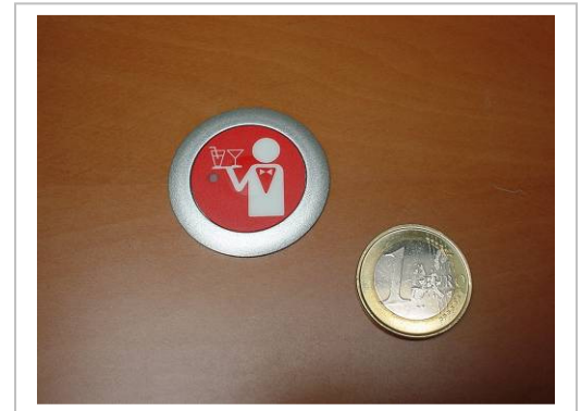
Beispiel: Eingebaut in Tischplatte

Der neue Funkruf-Knopf „Mini“ eröffnet mit seinen winzigen Abmessungen (30mmØ x 13mm Tiefe) dem Gastronom neue lukrative Chancen, für seinen Gast auch an weitläufigen Orten mit eingeschränkter Blickverbindung (z.B. Terrassen, am Swimming-Pool, in Wellness-Bereichen, am Badestrand etc.) jederzeit leicht erreichbar zu sein, wo es bisher nur mit größerem personellem Aufwand möglich war, dem Gast auch dort spontane Wünsche zu erfüllen.